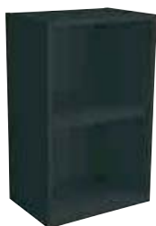
Grigio antracite Anthracite grey

L'elemento con anta vetro ha il ripiano in cristallo Units with a glass door come with a glass shelf