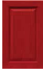
Rosso rubino Ruby red