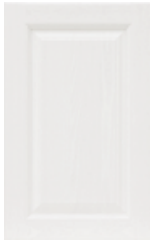
Bianco gesso Chalk white