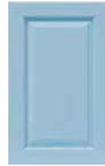
Azzurro Pale blue