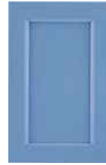
Azzurro Pale blue