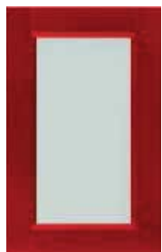
Anta vetro satinato Frosted glass door