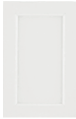
Bianco gesso Chalk white