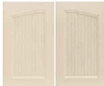
Ante sagomate Shaped doors Solo pensile H. 72x45 Only wall unit H. 72x45