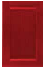
Rosso rubino Ruby red