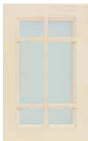
Anta inglesina vetro satinato * Frosted glass door with muntins *