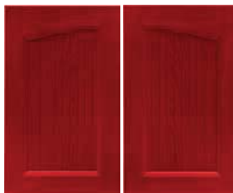
Ante sagomate Shaped doors Solo pensile H. 72x45 Only wall unit H. 72x45