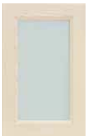
Anta vetro satinato Frosted glass door