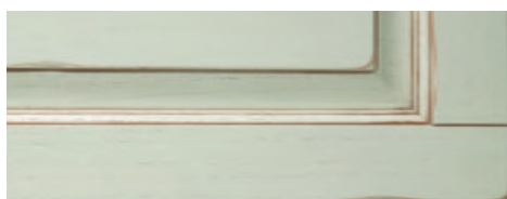
Acqua di mare anticatura noce Sea water finished walnut shading