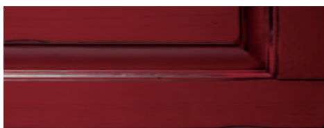
Rosso cina con anticatura nero Red China finished with black shading