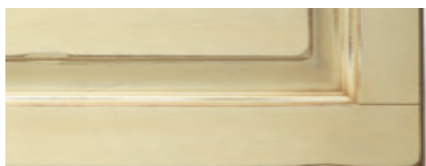
Giallo senape con anticatura noce Yellow mustard finished with walnut shading